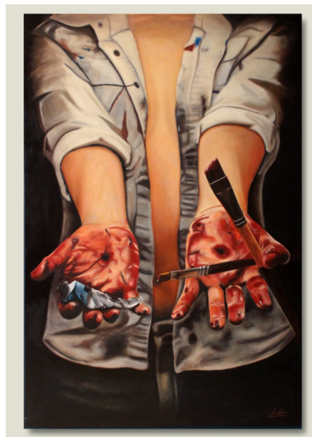
“Estigma de oficio” Óleo en bastidor Por: LoGa

“Actualmente siento que no hay algo característico de mis obras ya que me encuentro en una constante búsqueda de experimentación de materiales y estilos para poder llegar a eso que las caracterice” nos menciona LoGa sobre su arte. Lo que la inspira es la exploración del inconsciente humano, siente una gran atracción hacia la investigación sobre el comportamiento de los humanos, relacionados en temas como la psicología, la filosofía y la historia del por qué actuamos como lo hacemos y cómo realizamos acciones inconscientemente.