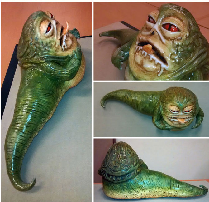
POR: CARLOS RODRÍGUEZ

Siempre apreciar dónde se puede aprovechar la ilustración, en qué plataforma, qué medios, ahorita ya se ha diversificado mucho hay muchas posibilidades de aplicarla y tienen que aprovecharlo; siempre tienen que saber canalizar su creatividad, yo por ejemplo lo hago por diferentes medios y no solo en el diseño, también siempre tienen que ser constantes y creer en en si mismo, tienen que tener humildad, ser sencillos, ser observadores, conocer lo más que se pueda de todos los aspectos de la vida, de todo el entorno, social, cultural, eso cuenta mucho para la producción.