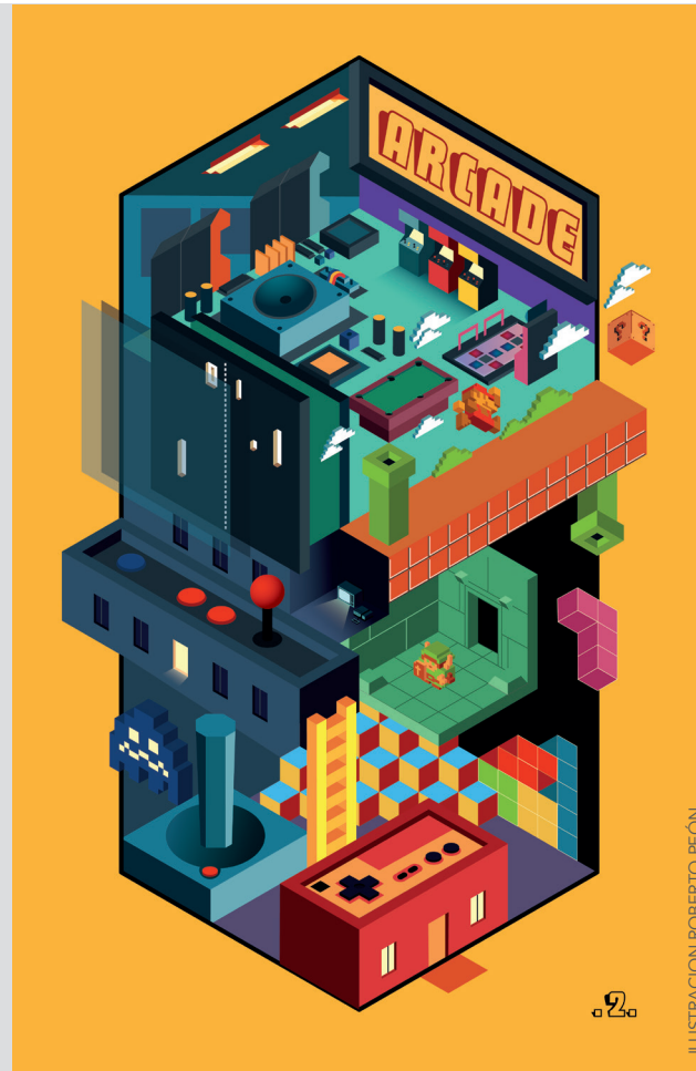
ILUSTRACION ROBERTO PEÓN

“Al final de cuentas a todos nos llega una oportunidad y si de verdad les gusta esto sean pacientes y estén más ahí por el amor a lo que hacen que por lo que quieren lograr. Los frutos vendrán más adelante, y lo digo como una persona que aún no le llegan esos frutos, pero entiendo que si estoy aquí es porque amo estar aquí y porque sé que algún día llegarán, por el momento es disfrutar el camino y ser paciente en que ya vendrá”.