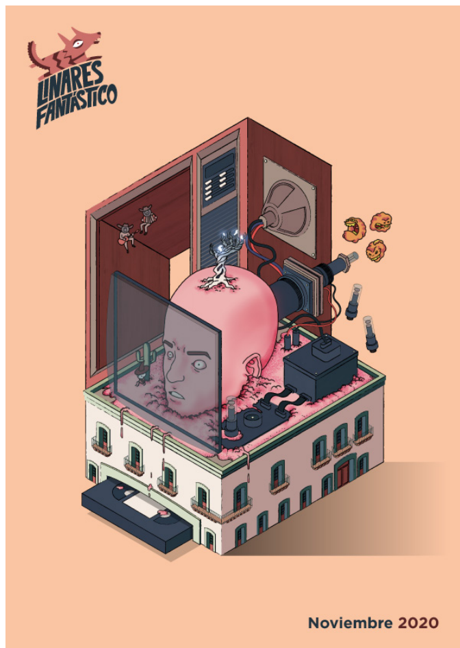
ILUSTRACION ROBERTO PEÓN

“Son de los compañeros a quienes tienes a tu mismo nivel y llegas a aprender de muchas personas. El estudiar diseño puede ser no igual, pero si similar en muchas partes o hasta puedes lograr entenderlo por tu propia cuenta si te abocas a ello, pero es más bien el hecho de estar en FAV y la experiencia para conectar con las demás personas de tu generación lo que a fin de cuentas te enriquece”.