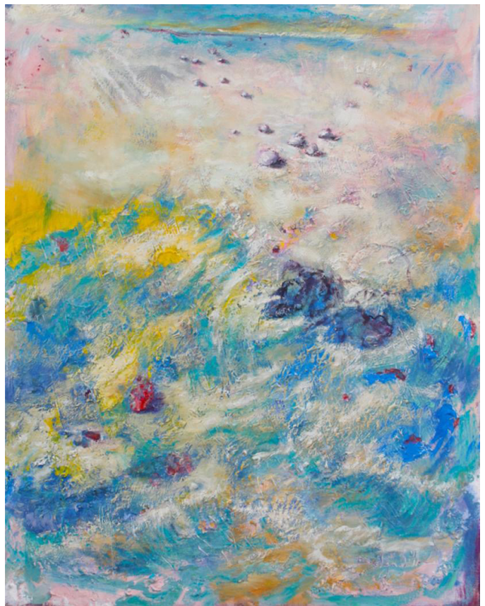
OBRA DE ALFONZO DELGADILLO