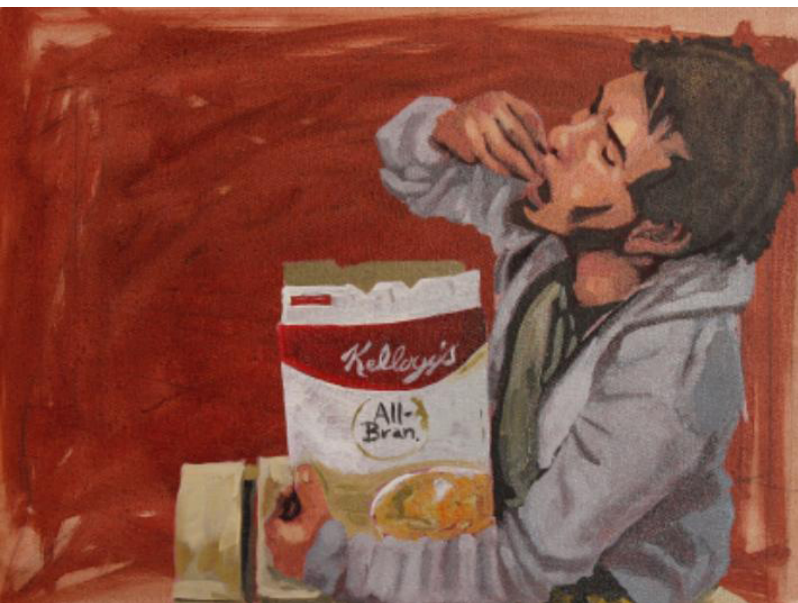
OBRA DE RAFAEL ORTEGA

Montserrat nos comenta que para ella Carrión es un autorreconocimiento hacia un camino del aprendizaje y poder compartir con los demás. Y es que a través del arte podemos reflejar y predecir los procesos personales y sociales. Toda persona es capaz de ser creativa y esto es una necesidad, un impulso innato de los seres humanos.