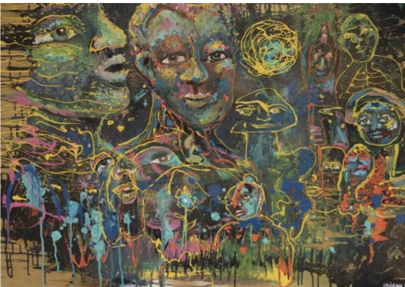
OBRA DE VIVIANA SOFÍA