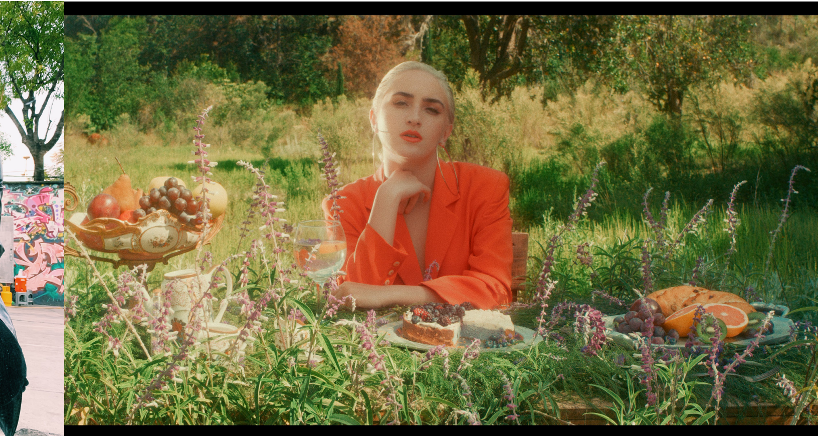
POR: BLACK BUFFALO FILMS