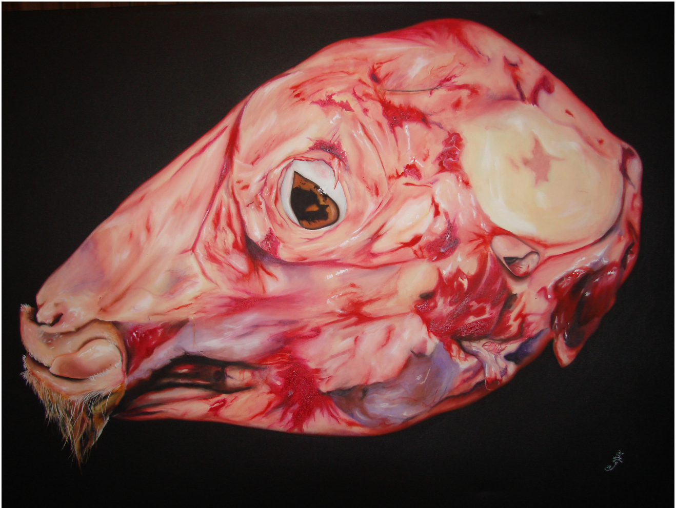
"Ya estoy mejor" Obra por Carlos Robledo, acrílico sobre madera.

De todas las obras de las que usted ha realizado, ¿Hay alguna a la cual le haya agarrado un amor muy grande, que le haya generado mucho cariño?