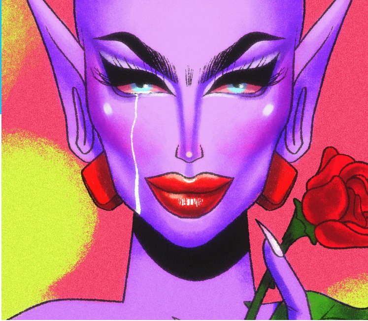
ILUSTRACIÓN: ALEX M

personas, a veces imaginarias, que reflejan estética o figurativamente sentimientos que tengo en mi día a día. Vas a encontrar montones de rojo, rosa y morado, personajes femeninos poderosos, cultura pop y algunas ilustraciones originales que representen momentos de mi vida.