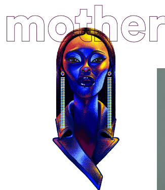
ILUSTRACIÓN: ALEX M

Incluso conocer personas, situaciones de la vida cotidiana, todo te ayuda a construir tu perspectiva como ilustrador, sólo tienes que darle tiempo y estar en “frieга” dibujando, experimenta y solita va a llegar.