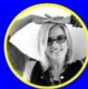
ROSEMARY MARTÍNEZ @Rosemary_Mtz

Gabriel Meave menciona que es bueno ser todólogo, y en tiempos de crisis es una muy buena opción, el ser ilustrador, hacer identidad, hacer tipografías, tener mayor flexibilidad te hace tener más clientes. El pago de regalías es el mejor ingreso si creas contenido que lo pueda generar a largo plazo. El éxito de un diseñador se basa en el éxito de nuestros clientes, mencionó Meave.