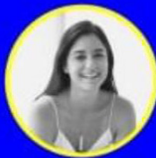
ANA CISNEROS @baiku_estudio