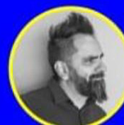
PAULO VILLAGRÁN @Pauloensuestudio