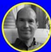
JUAN CARLOS FERNÁNDEZ @ideograma