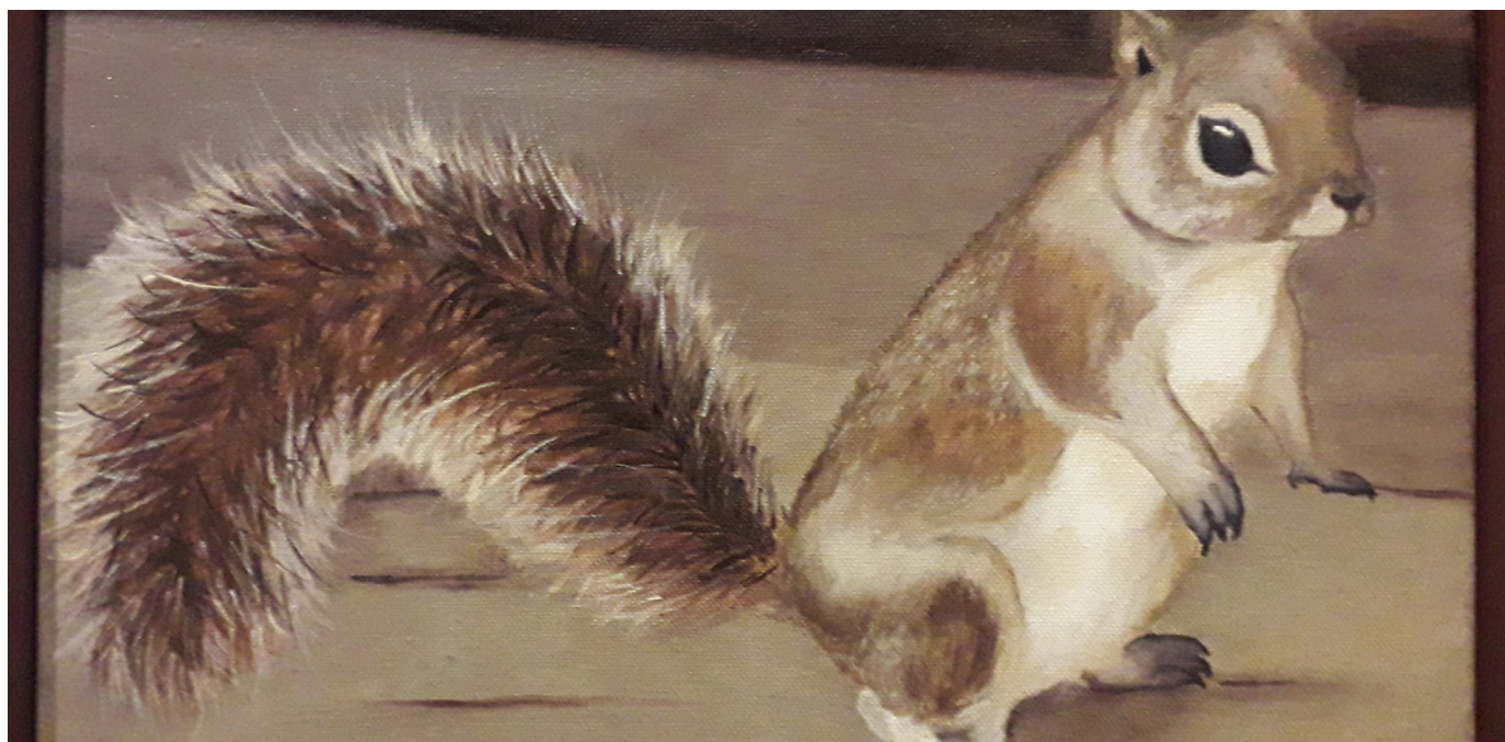
Título de la obra: Un recuerdo agradable