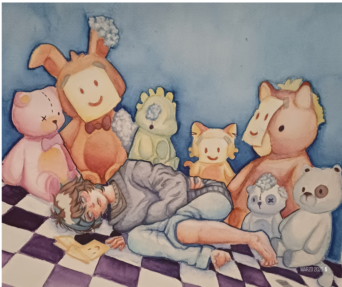
Título de la obra: ¿Dónde están?