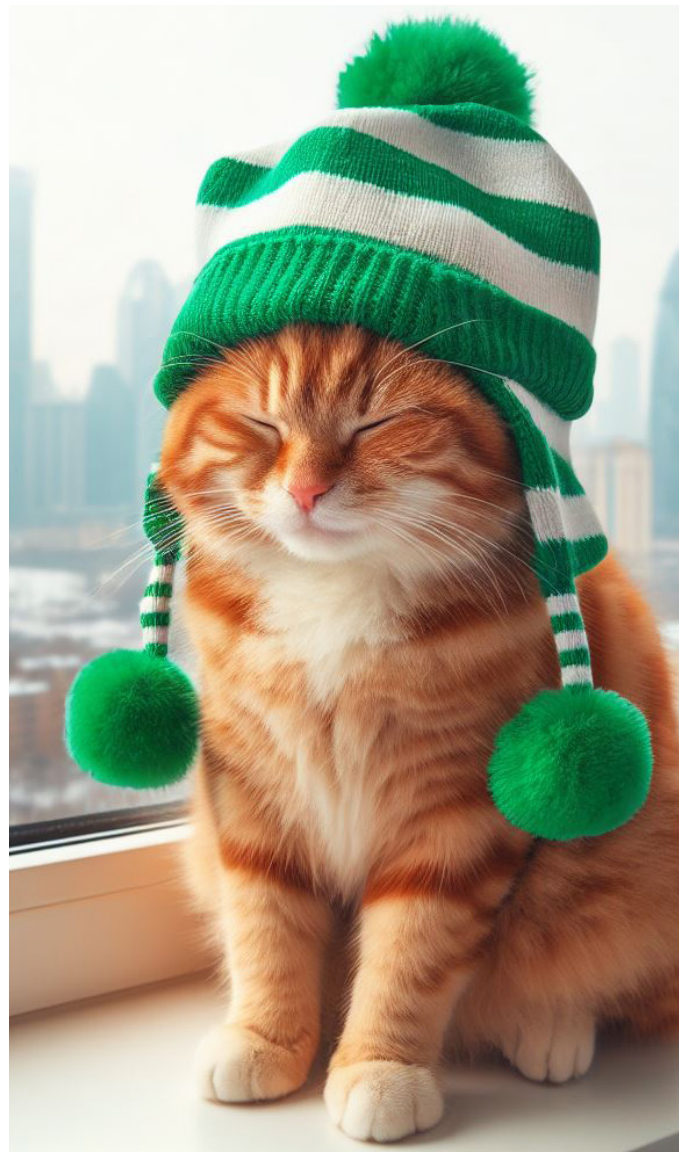
Imagen generada con Bing Gato con Sombrero

Esta aplicación es la que más causó revuelo entre artistas, diseñadores, y creadores de contenido digital. Se trata de DALL-E , un sistema de inteligencia artificial creado por OpenAI , los mismos creadores de ChatGPT . Está basada en GPT-3, un modelo de lenguaje con bastantes parámetros por lo que puede entender e interpretar el lenguaje humano de forma natural, porque está entrenada para identificar lo que queremos expresar. Esta inteligencia artificial puede crear imágenes tan solo escribiendo que es lo que queremos, es por esta razón que causo una gran polémica entre los internautas, ya que, si el crear imágenes es tan sencillo como indicarle a la computadora que es lo que queremos, las carreras como diseño gráfico, artes visuales y artes plásticas no serán necesarias en el futuro. Eso es lo que co-