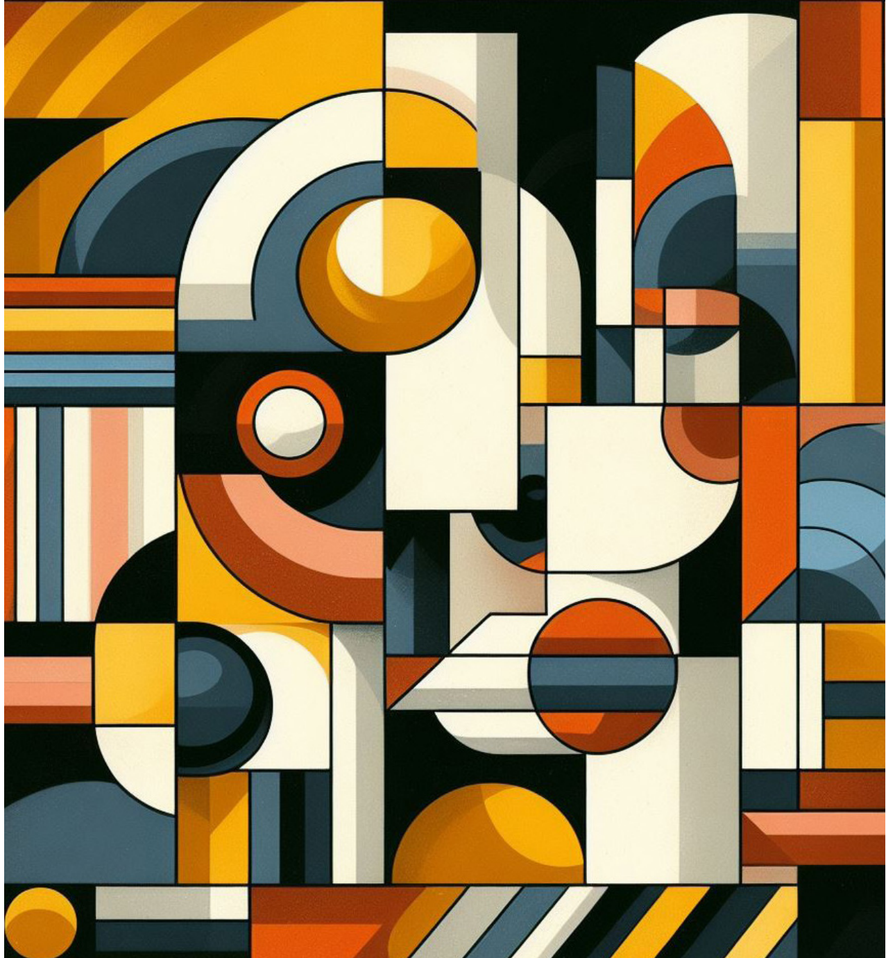
Imagen generada con Bing al estilo Pablo Picasso