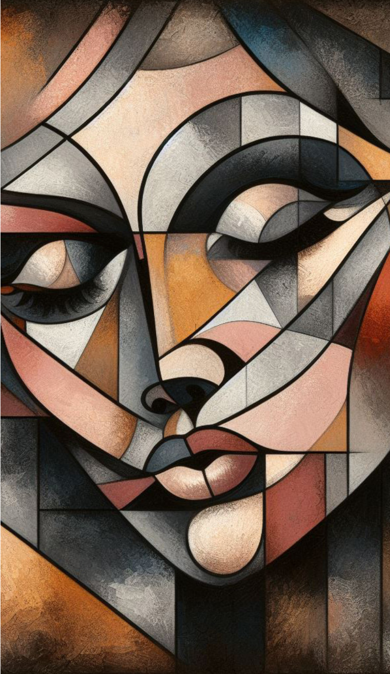
Imagen generada con Bing al estilo Pablo Picasso