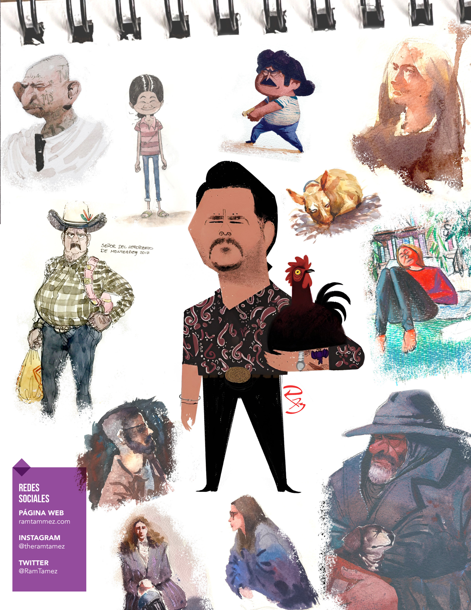
SEÑOR DEL AEROPUERTO DE MONTERREY 2017