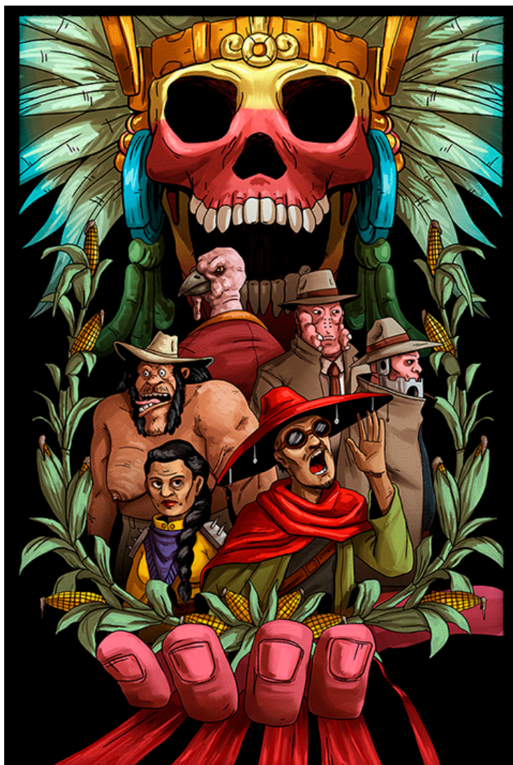
Ilustración por: El Manchón (Rubén Arriola)

El Manchón es un dibujante independiente de historieta, caricaturista y cronista social, lo que en México se conoce como un “monero”. En su obra mezcla crítica social, un humor ácido y absurdo cargado de irreverencia donde juega con los personajes del imaginario social mexicano.